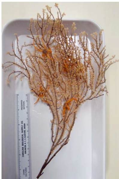
Diese Tiefseekoralle, gefunden in etwa 2.200 m Tiefe am Detroit Seamount, bot sechs Schlangensternen Unterschlupf.