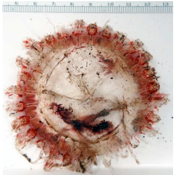
Quallen kann man auch in der Tiefsee finden. Diese sog. Kranzqualle ( Atolla sp.) wurde in etwa 3.200 m Tiefe südlich des Detroit Seamount gefangen.