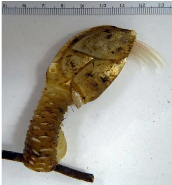
Diese große Entenmuschel - vermutlich zu den Lepadidae gehörend - wurde am Stalemate-Rücken in etwa 3.000 m Tiefe gefunden. (Alexander Ziegler)