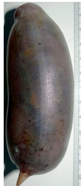
Bei diesem merkwürdig geformten Exemplar handelt es sich um einen Vertreter einer Gruppe von Tiefsee-Seeurken. Das Tier wurde in 4.100 m Tiefe am Detroit Seamount gefunden. (Alexander Ziegler)