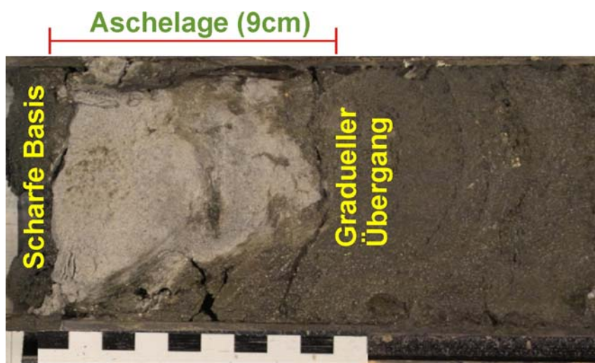
Abb. 2 Aschenlage der Chiltepe Eruption (ca. 2000 Jahre)

Die große Bedeutung, die der charakteristischerweise explosive Vulkanismus von Subduktionszonen auf die marine Sedimentation hat, zeigte sich in zahlreichen Kernen vor Nicaragua in Form von Aschelagen und Aschelinsen. Aufgrund ihrer stratigraphischen Lage innerhalb der Kerne und ihres Erscheinungsbildes konnten vorläufige Zuordnungen zu Eruptionen an Land vorgenommen werden. Das Beispiel-Photo zeigt eine 9 cm mächtige Aschelage, die vermutlich mit der ca. 2000 Jahre alten Chiltepe Eruption vom Apoyeque Vulkan nahe der nicaraguanischen Hauptstadt Managua korreliert werden kann.