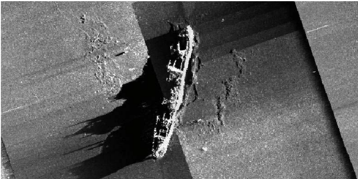
Abbildung 2: Detailbild einer hochauflösenden „Sidescan“-Kartierung mit einem ca. 120 m langen Schiffswrack in ca. (4500 m Wassertiefe).

Neben diesen positiven Ergebnissen gab es in der zweiten Expeditionswoche jedoch auch einige Überraschungen sowie technische Probleme an einigen Geräten. Letztere konnten fast ausnahmslos und meist sehr schnell wieder gelöst werden. Zu den lehrreichen Erfahrungen dieser Expedition gehört eindeutig, dass nicht jede der, während früherer Expeditionen auskartierten, sogenannten „Backscatter“ Anomalien am Meeresboden (hohe Rückstreuung eines akustischen Signals) von passender räumlicher Ausdehnung die Existenz eines Schlammvulkans anzeigt. Auf zwei in dieser Woche durchgeführten AUV-Tauchgängen waren die dortigen „Backscatter“ Anomalien nicht auf geologische Besonderheiten, sondern auf dort liegende Schiffswracks zurückzuführen. Abbildung 2 zeigt das größere der beiden auskartierten Wracks, worauf auch zahlreiche Details zu erkennen sind, die sogar eine spätere Identifizierung des Schiffswracks ermöglichen sollten. Das Vorhandensein vieler Schiffswracks in dieser Region ist sicher auf die räumliche Nähe zur Straße von Gibraltar deren zentraler Bedeutung im Schiffsverkehr zurückzuführen.